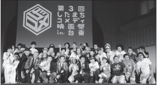
↑「ガチョーン！」で締めたリスベクトライブ

● インターネット放送大反響！ い／今回は、ユーストリーム(インターネット放送)で「したコメ」の生の映像も放送したけど、これも反響大きかったね。 ● 敬意をもった「ガチョーン！」で出演者と一緒に映画祭を締められたことが嬉しかったな。