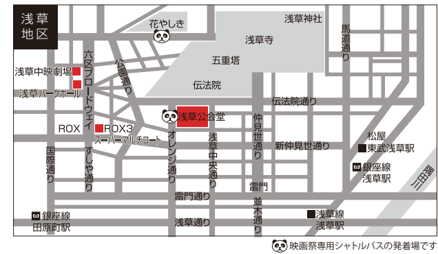
映画祭専用シャトルバスの発着場です